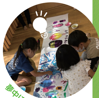
夢中になって遊び学ぶ